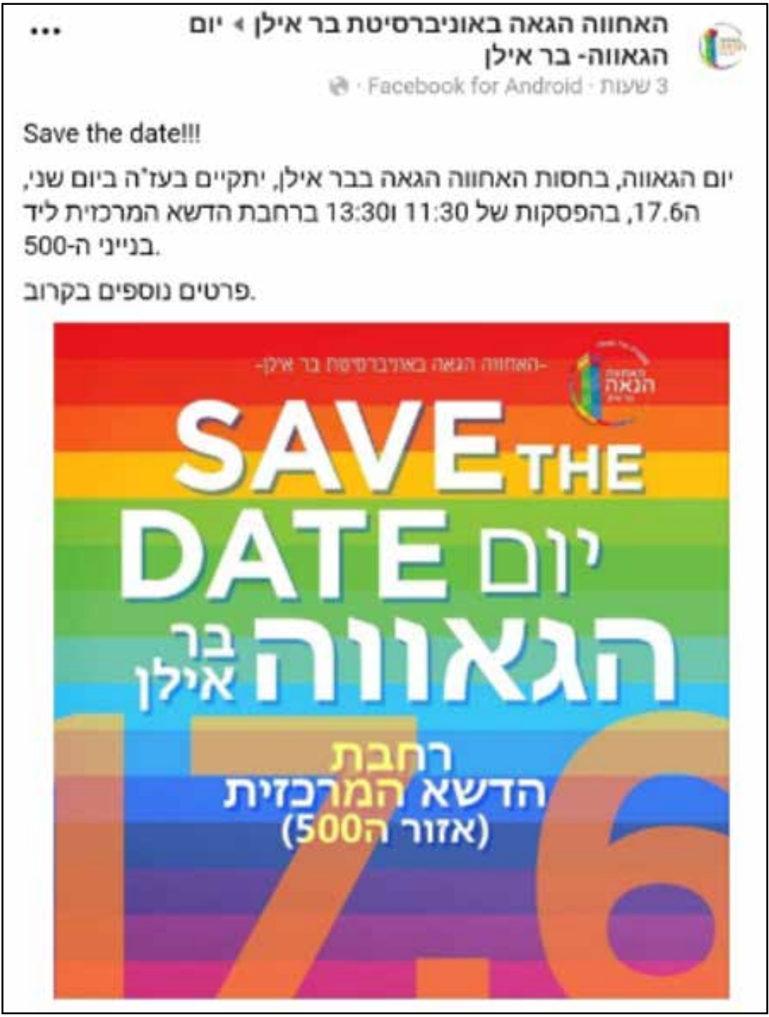
פרסום על יום ה"גאוה" 2019 בקמפוס אוניברסיטת בר אילן