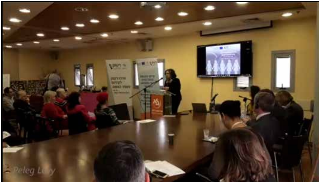
בתמונה: ח"כ עאידה תומא סלימאן בכנס של מרכז רקמן בנושא "חשיבות העבודה הבינ"ל בקידום מדיניות בישראל" (פברואר 2018) 34