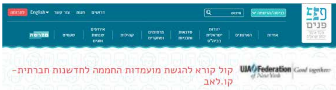
קול קורא להגשת מועמדות ל'קו-לאב' באתר 'פנים' 13

מדובר באחד הפרויקטים המובילים של הפדרציה בארץ, שנועד לממש את החזון שלה להחדרת תפיסות פלורליסטיות וליצירת חברה חדשה בישראל. לשם ביצוע המטרה, מארגני המיזם בוחרים משתתפים הבאים מקבוצות שונות של החברה: ערבים, בדואים, חרדים, קיבוצניקים, אתיופים, להט"בים, פעילי שמאל ופעילים לשינוי הזהות היהודית (למשל, באחד המחזורים השתתף בכיר בתנועה הקונסרבטיבית). בכל מחזור משתתפים 20-18 חברים. המשתתפים עוברים תהליך של כחצי שנה בו הם מתחברים אחד לשני ונחשפים לתפיסות פלורליסטיות. בכל חודש במהלך הקורס מתקיימים כשלושה ימי מפגש מלאים, פעמים רבות כולל לינה. המיזם כולל טיסה של כל המשתתפים לארה"ב כדי להכיר מקרוב כיצד קהילות יהודיות מזרמים שונים חיות בשיתוף פעולה, כדברי המארגנים. 12